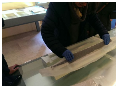
La spada celtica appena arrivata a Manerbio

Il National Geographic, in un numero del 1978, aveva dedicato ampio spazio ai ritrovamenti di epoca celtica in territorio di Manerbio, indicando il centro della Bassa Bresciana come un luogo fulcro delle tribù dell'area padana. Nel 1985, era stato inaugurato il Museo Civico e del Territorio dove erano stati raccolti i preziosi reperti, rappresentativi dello sviluppo della zona in un arco